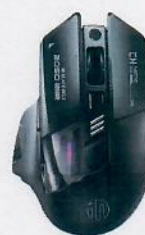
Souris sans fil