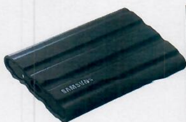
Disque dur externe