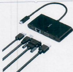
Adaptateur (GBE, HDMI, VGA, USB-A), BLK